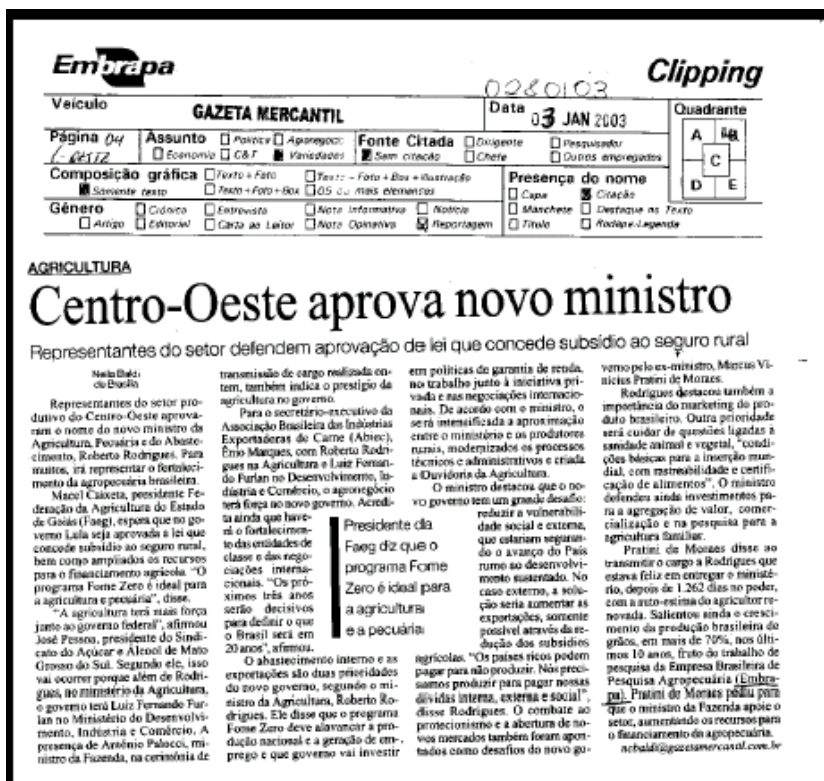
Figura 1: Página digitalizada do Clipping Eletrônico

Veja na figura 1, um exemplo de uma página do clipping antes da digitalização.